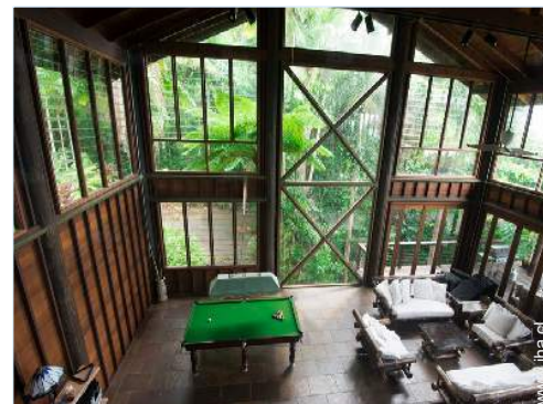
vista desde el entresuelo

Parrilla a gas, mesa con rodante, balancín