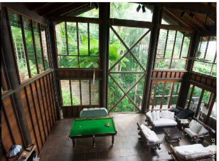
vista desde le entresuelo